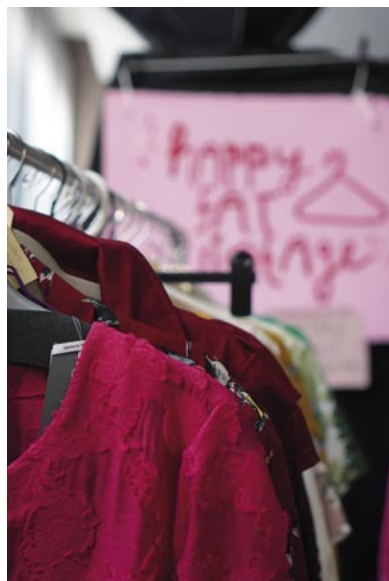
Der erste «Curvy Flohmi» in Muri war ein grosser Erfolg.

Betriebsübergabe der Firma «bonapp Catering & so AG»