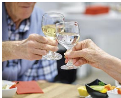
Zum Abschluss des Anlasses wurde ein feines Apéros serviert.

Die Fachstelle für Altersfragen hat gemeinsam mit der Reformierten Kirchgemeinde Muri-Gümligen zum ersten Mal den Internationalen Tag des älteren Menschen begangen. Am Sonntag, 1. Oktober trafen sich fast 70 Personen im Bärtschihus, um das Alter mit all seinen Facetten zu feiern. Es wurde gelacht, gegessen und man konnte sich über Demenz informieren.